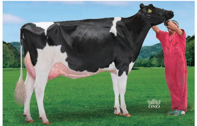
曾祖母:TMF ゴールド ルーフアス ビスタ ET VG-89 2012年 北海道ナショナルショウ ジュニアチャンピオン 2013年 北海道ナショナルショウ 2歳シニア級 1等1席 2ND BU

曾祖母:ルーフアス・ビスタ・ETは'12年ナショナルショウにおいてジュニアチャンピオンを獲得!また翌'13年ナショナルショウでは2歳シニア級1等1席を獲得しております。母:マツカチエン・ビスタもショウカウとして活躍しており、第9回全日本B&Wショウ第2部において1位を獲得しており、体型得点はVG-88に評価されております。