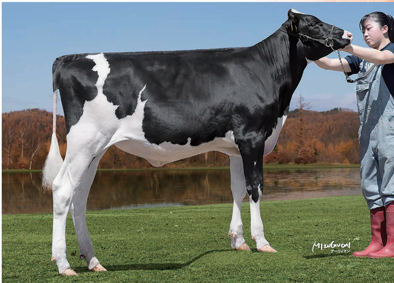
エステリア ルーフアス ビスタ ユニクス ルンバ

GPI(2021年02月) GNTP +901 42%順位 体型 52 %R +0.95 FS +0.39 FL +1.22 UD 能力 56 %R 79%順位 -14586 円 -331 M +33 F +0.50 F% +1 P +0.12 P% -48 SNF +0.01 SNF%