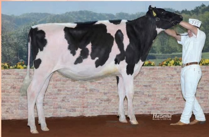
母:OTR マツカチエン ビスタ VG-88 第9回全日本B&Wショウ 第2部 1位