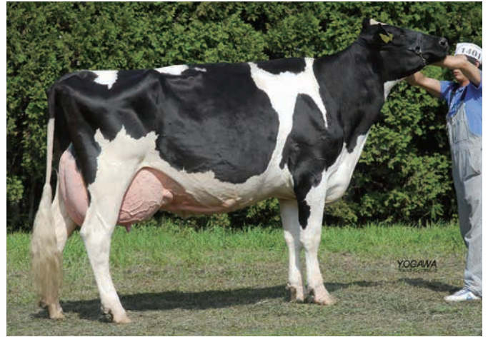
曾祖母:ウエツジウッド ギブソン プリズム ET EX-92 2006年 北海道総合畜産共進会 成年級 1等2席

まるでスタンプを押したかのように好タイプ娘牛ができるパフユーム×キングドックのクロス。本牛も発育極めて良好、好体型です。本牛のフルシスターであるキング・パフユーム・ETは体型得点2歳GP-83、乳器84の好体型に加え、305日の期待乳量が14,590kgと高能力を示しております。シヨウカウ作出、または牛群の基礎としてよろしくお願ひします。