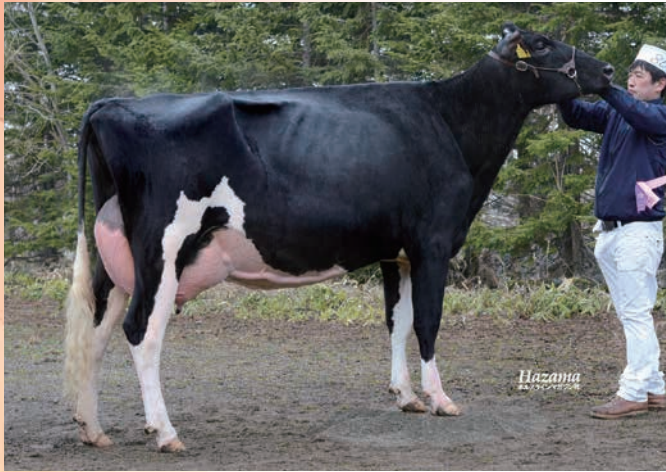
母:リラファーム GW パフユーム ET VG-89 2011年 北海道総合畜産共進会 ジュニア2歳級 1等6席