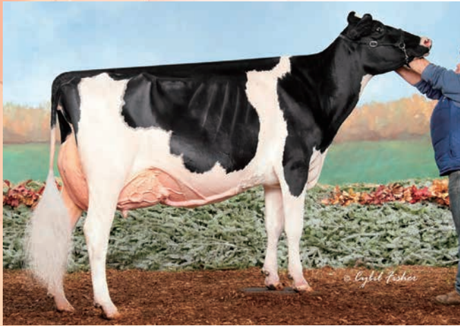
母:リングル ゴールド フリーキー ガール ET EX-93