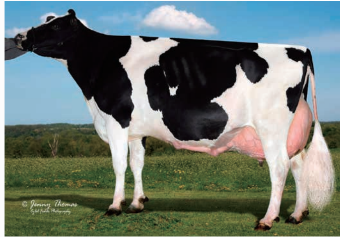
祖母:リングル DD ファアサム EX-94

母:フリーキー・ガール・ETは'16年WDEにおいて2歳シニア級1位およびインターメディアイトチャンピオン獲得の好体型牛であり、'17年にもオールアメリカンにノミネートされております。