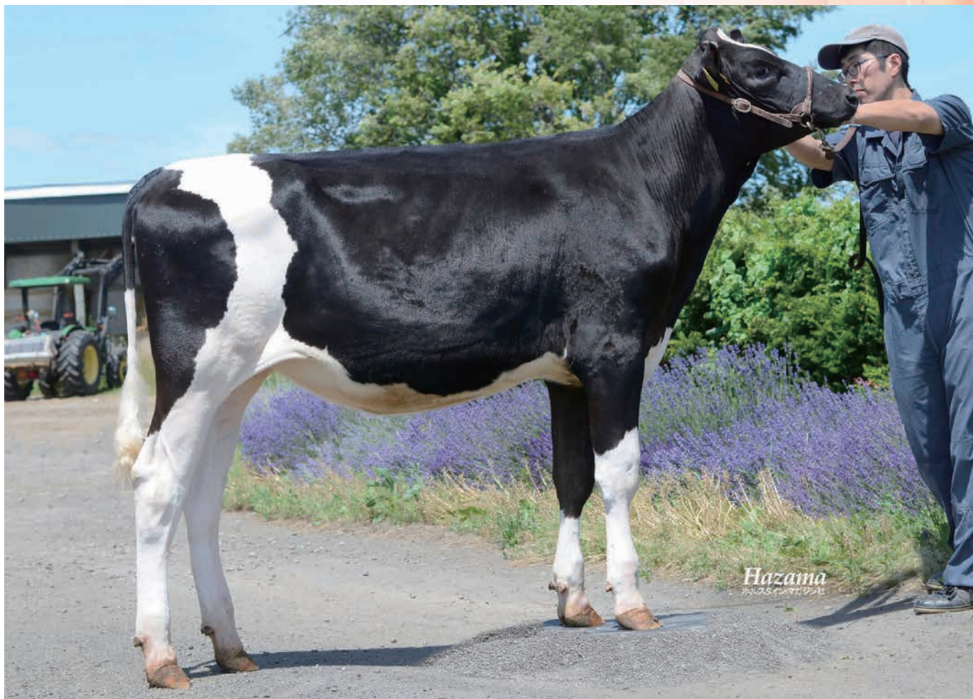
ウインホープ ゼルーナ ET

GPI(2021年02月) GNTP +2515 2%順位 体型 38 %R +0.79 FS +0.04 FL +1.58 UD 能力 43 %R 9%順位 +90316 円 +640 M +54 F +0.29 F% +38 P +0.19 P% +92 SNF +0.32 SNF%