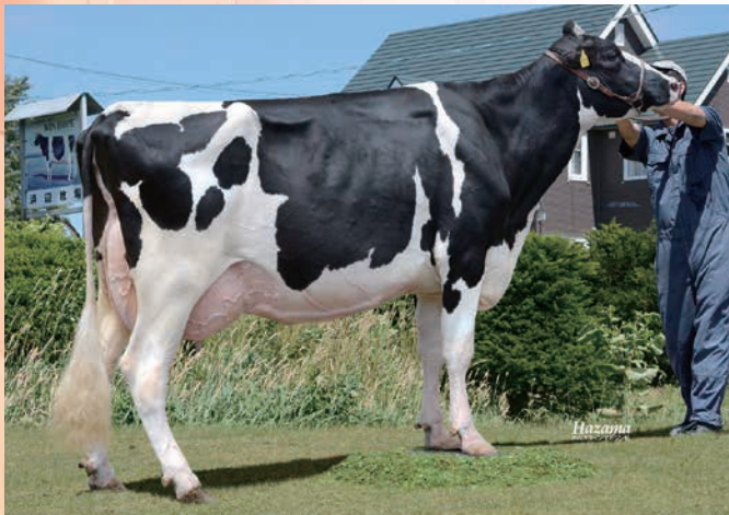
母:ウインホープ ゼルダ ET GP-84