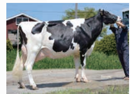
母のフルンスター:ウインホープ ゼアス ET VG-85