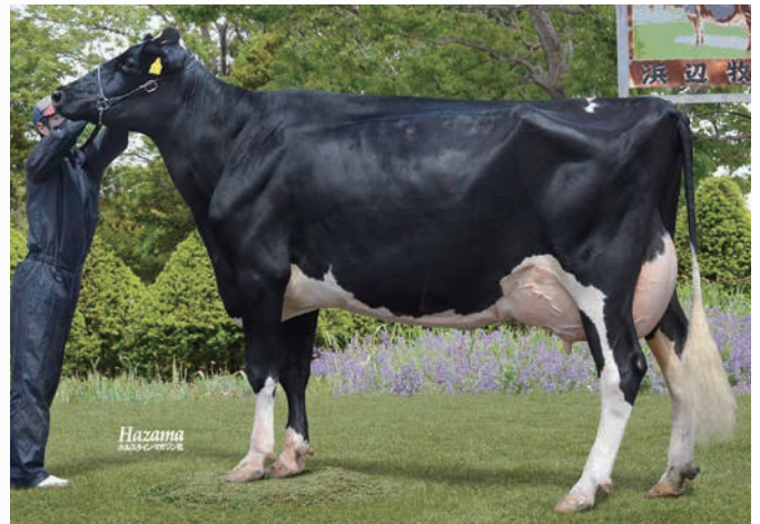
祖母:ウインホープ ジーター ET VG-89

祖母:ジーターはウインザー・マナー・ルド・ジツプ・EX-95の4代目であり、当場の看板牛として30頭超の娘牛や息子を生産しております。今春再び分娩し、10歳を超える現在も元気に泌乳しております。母:ゼルダの全姉であるゼアスは未経産ゲノミック評価において全国1位、経産牛NTP3位。同じくゼブラは経産牛NTP20位となっており、エリートカウとして活躍しております。本牛:ゼルーナはGNTP+2,515とファミリーのハイゲノミックを引き継ぐ1頭であります。またアメリカのゲノミック評価においてもGTPI+2,634、ネットメリット(NM) 523、M+926kg F+0.12% P+0.04% 生産寿命(PL)+3.1 体型+1.64と体型・能力共に高評価を得ております。ファミリーの搾乳性、長命性を引き継ぎつつ、日米双方で高評価のゼルーナをよろしくお願ひします。