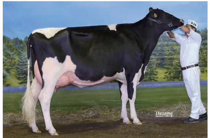
祖母:DH チャンス メイク ET VG-87 2015年 第14回北海道全共 名誉賞 2016年 北海道ナショナルショウ 2歳ジュニア級 1等2席

本牛は当場を代表する”チャンス”ファミリーで、21年北見B&Wショウにおいてリザーブジュニアチャンピオンを獲得した好体型牛であります。 母:チャンス・ゾロは、19年北海道総合畜産共進会において第5部1等2席を獲得しており、祖母:チャンス・メイク・ET、曾祖母:アタツク・チャンスと続き、出品番号1号牛とは母同士が異父姉妹にあたります。 代々ショウリングで活躍しているファミリーとなっておりますのでよろしくお願ひします。