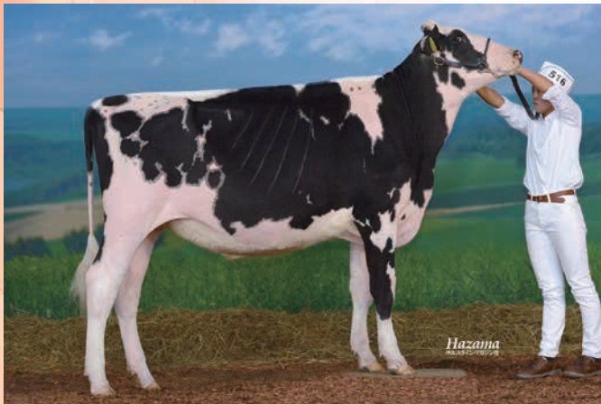
母:DH チャンス ゾロ GP-83 2019年 北海道総合畜産共進会 未經産ミドルクラス 第5部1等2席