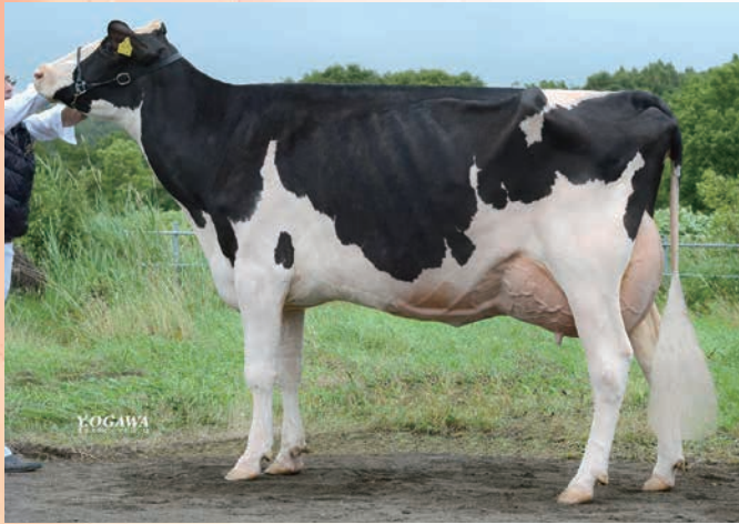
母:レスポアール ファーストウインド ハーゲン ET EX-91 2015年 北海道ナショナルショウ 2歳ジュニア級 1等5席