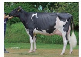
フルンスター: レスポアール ショウリングスター ハーゲン ET VG-86

レスポアール レーガンスター ハーゲン 登録番号:0812002940 血統濃度 100% BLF CVF EBV(2021年02月) NTP +82 58%順位 体型 71 %R +1.00 FS +1.03 FL +0.60 UD 能力 82 %R 59%順位 +357円 +127 M -29 F -0.35 F% +8 P +0.04 P% +14 SNF +0.03 SNF%