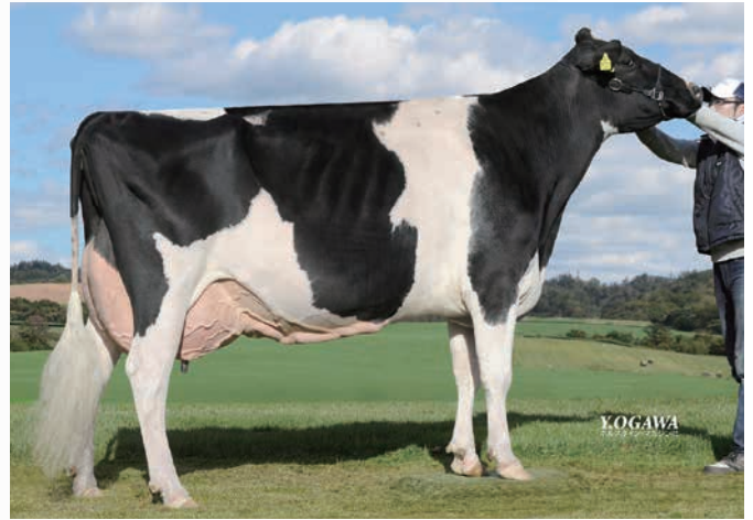
祖母:レスポアール レーガンスター ハーゲン EX-96 2006、'07、'15年 全道共進会グランドチャンピオン

ファミリー通算EXが150頭を超え、全国にファミリーの輪が広がっております。 今年のお品牛の母はJr2歳級で全道1等賞、能力も15,000kgオーバーのファーストウインド・ハーゲン・ET!!そして、祖母は日本最高得点であるEX-96のレーガンスター!!この魅力あふれる血統を是非あなたの牧場に導入されては如何でしょうか。 本牛の名の通り”夢への挑戦”と一緒に目指しませんか?どうぞよろしくお祈りします。