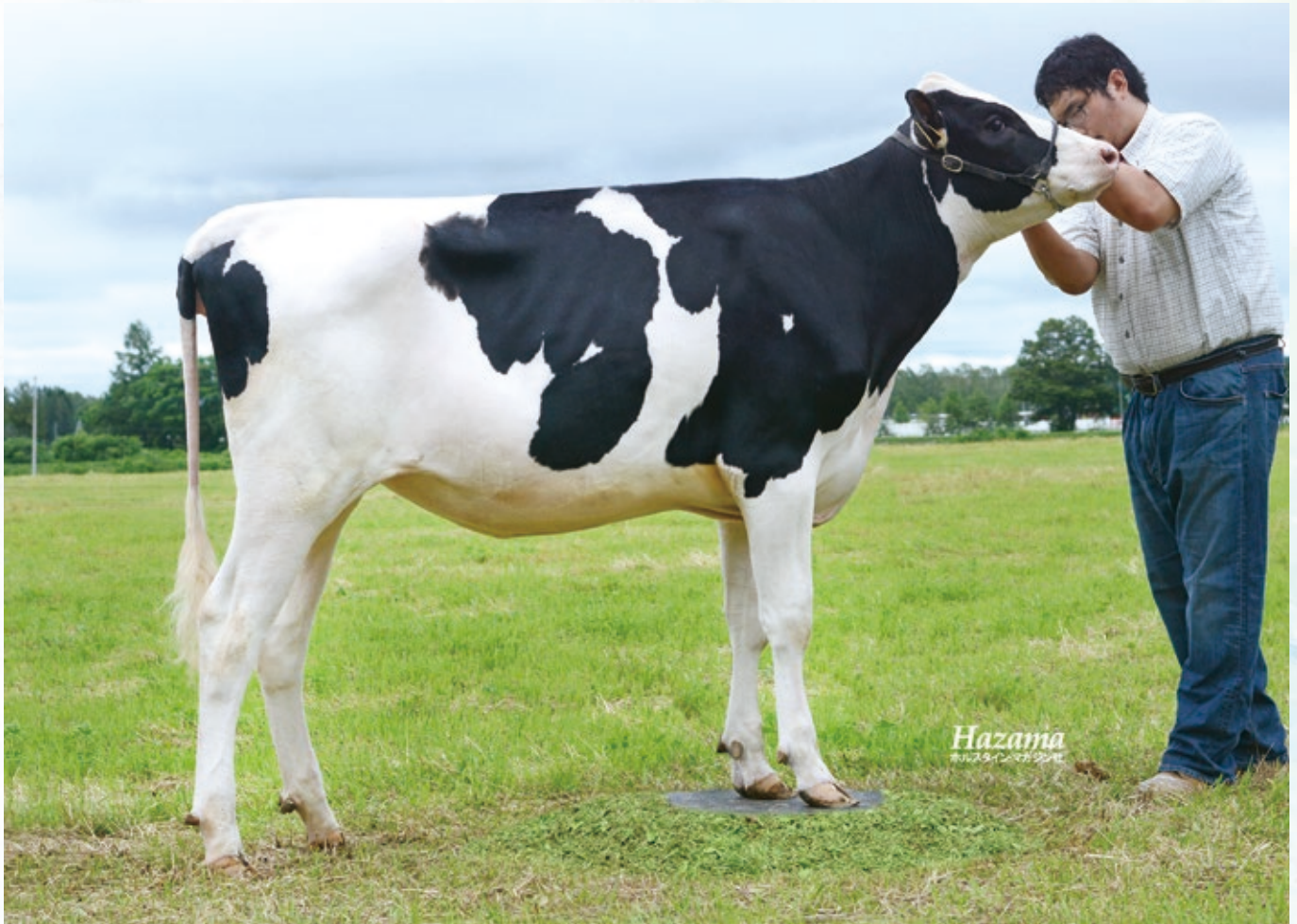
YKT ラムセス バーバラ

GPI(2022年02月) GNTP +1478 22%順位 体型 50 %R +1.31 FS +0.45 FL +2.02 UD 能力 55 %R 31%順位 +59429 円 +523 M +30 F +0.07 F% +16 P -0.05 P% +20 SNF +0.04 SNF%