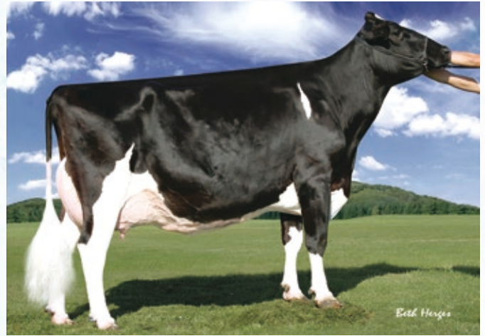
5代母:レーガンクレスト-PR バービー ET EX-92

本牛は、EX-96で6代EX、'19年WDEにおいてグランドチャンピオンを獲得したゴールド・バーバラ・ETの3代娘牛にあたります。またゴールド・バーバラ・ETはPR・バービーの孫ということでファミリーとしては文句なし。好体型、高能力、種雄牛生産と、世界の乳牛改良に大きく貢献しました。母はモーグルを父に持ち、EX獲得まであと一歩!!能力も非常に高く魅力的です。本牛は人気種雄牛である“デルタラムダ”を父に持ち、胸底が広く、肋の開張、長さも十分であり、将来性があり、期待が高まります!この機会によりしくお願いします。