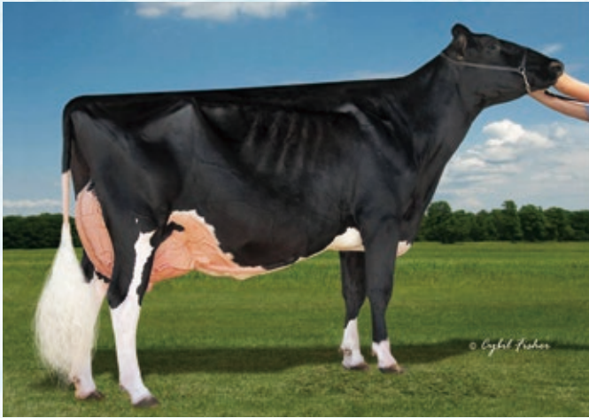
3代母:バツズバトラー ゴールド バーバラ ET EX-96 2019年 WDEグランドチャンピオン