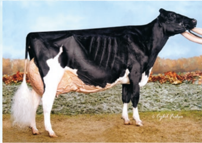
祖母:ロージャーズ ブレクシー ゴールドウイン ET EX-97 2017年 WDE シュープリームチャンピオン

祖母'17年WDEおよびRAWFにおいて成年級1位獲得のブレクシー・ゴールドウインであります。 ブレクシーは'17年WDEにおいてシュープリームチャンピオンも獲得!クラツシユの娘牛:バドワイザーも'19年WDEにおいてリザーブジュニアチャンピオンに輝くなど好体型娘牛を数多く輩出しております。またブレクシーの娘や孫は北米のセールでも高値で取引されております。 母:シド・ベス・ETも好体型を示しており、乳器はEX!母は4代EXも間近であります。本牛は発育良く、資質においても優れております。 ブレクシーの直系となる“ユニオン”をよろしくお願ひします!