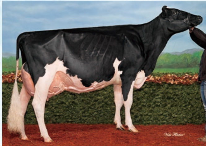
母:ヤコブス ゴールドウイン リサマリー ET EX-94 2017年 RAWF 成年級 1位

本牛はFerme Jacobsの代表牛の1頭であるゴールドウイン・リサマリー・ETの娘にあたります。リサマリー・ETは、'17年RAWFの成年級で1位を獲得し、オールカナディアンを獲得しました。