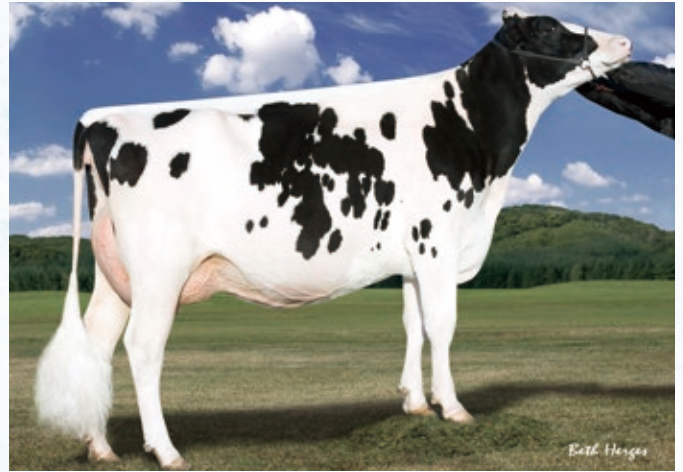
5代母:ラークレスト クリムゾン ET EX-94

本牛はクリムゾンのファミリーでGNTP+2,362であります。+1,968と高い産乳成分に加え、低い体細胞スコアを兼ね備え、健康的な泌乳能力に期待が持てます。 代々好体型、高能力で本牛も非常に期待が持てます。 ミルフオードを父に持つ本牛:クリムゾンをよろしくお願ひします。