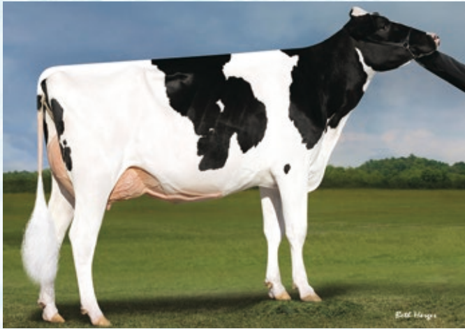
祖母:レーガンダンホフ ジエダイ カシミア VG-88